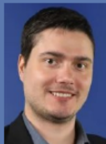
Rodrigo Fock Presidente do Congresso Brasileiro de GENÉTICA MÉDICA